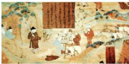
图中文字：……有一商主，将诸商人，贵持重宝，经过险路。其中一人，作是唱言，诸善男子，勿得恐怖，汝等应当一心称观音菩萨名号，是菩萨能以无畏，施于众生。汝等若称名者，于此冤贼当得解脱。众商人闻，俱发声言：南无观世音菩萨。称其名故，即得解脱。